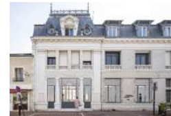
MONTREBAU L'AGENCE Activités ESS Logement