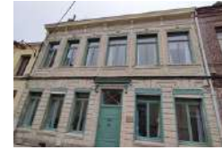
VALENCIENNES LA CLIQUE Logement