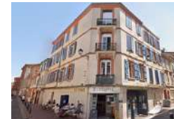
TOULOUSE L'ESCABEL Tiers-lieux