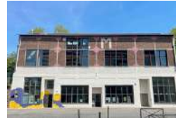
PARIS 19 LE TLM Tiers-lieux