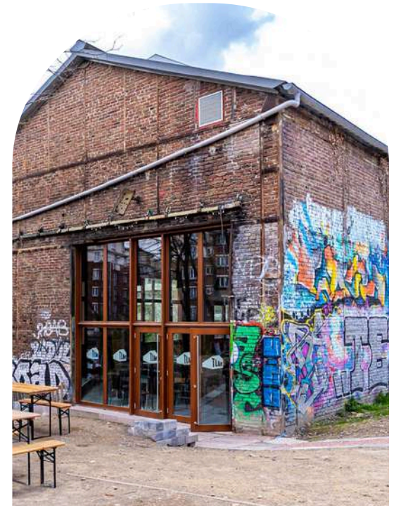
TLM, Paris photos : QUID credits photos