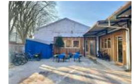
ILE SAINT-DENIS LA BALISE Activités ESS