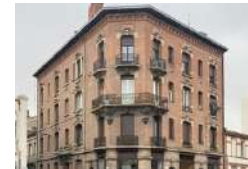
TOULOUSE LA COMPAGNIE DU CODE Activités ESS