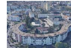
STAINS POLTO Activités ESS