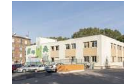
ILE SAINT DENIS LE PHARES Activités ESS