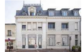
MONTREBAU L'AGENCE Activités ESS Logement