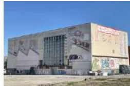
TOULOUSE LA SOUFFLERIE Tiers-lieux