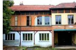
SENS COUR SAINTE PAULE Activités ESS Logement