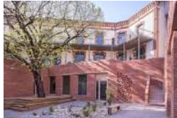
ALBI GÉNÉRATION PASTEUR Activités ESS Logement