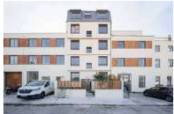
IVRY-SUR-SEINE PRUDHON Activités ESS Logement