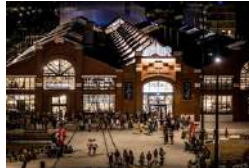
TOULOUSE LES HALLES DE LA CARTOUCHERIE Activités ESS Tiers-lieux