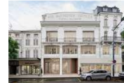
VERDUN AUX FABRIQUES RÉUNIES Activités ESS Logement