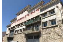
CLERMONT L'HERAULT MAISON CLOVIS Tiers-lieux