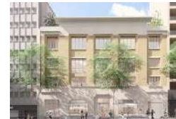
PARIS 18 LA MAISON DES MÉDIAS LIBRES Tiers-lieux