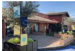
TOULOUSE LE CLOS JACQUIN Activités ESS