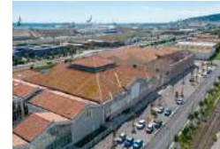
SETE LE CHAI DES MOULINS Tiers-lieux