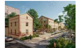
VITRY-SUR-SEINE HALLE DUMESTE Activités ESS