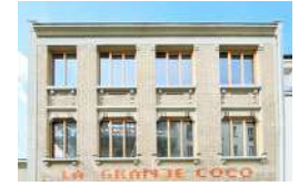
PARIS 20 LA GRANDE COCO Tiers-lieux Logement