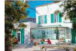
MARSEILLE LE TIERS-LAB DES TRANSITIONS Activités ESS Tiers-lieux