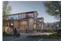
TOULOUSE HALLE ARTISAN AMOUREUX Activités ESS Tiers-lieux