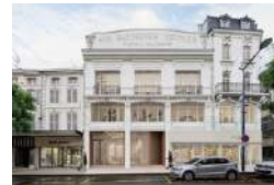
VERDUN AUX FABRIQUES RÉUNIES Tiers-lieux Logement