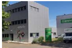
TRAPPES ENVIE Activités ESS