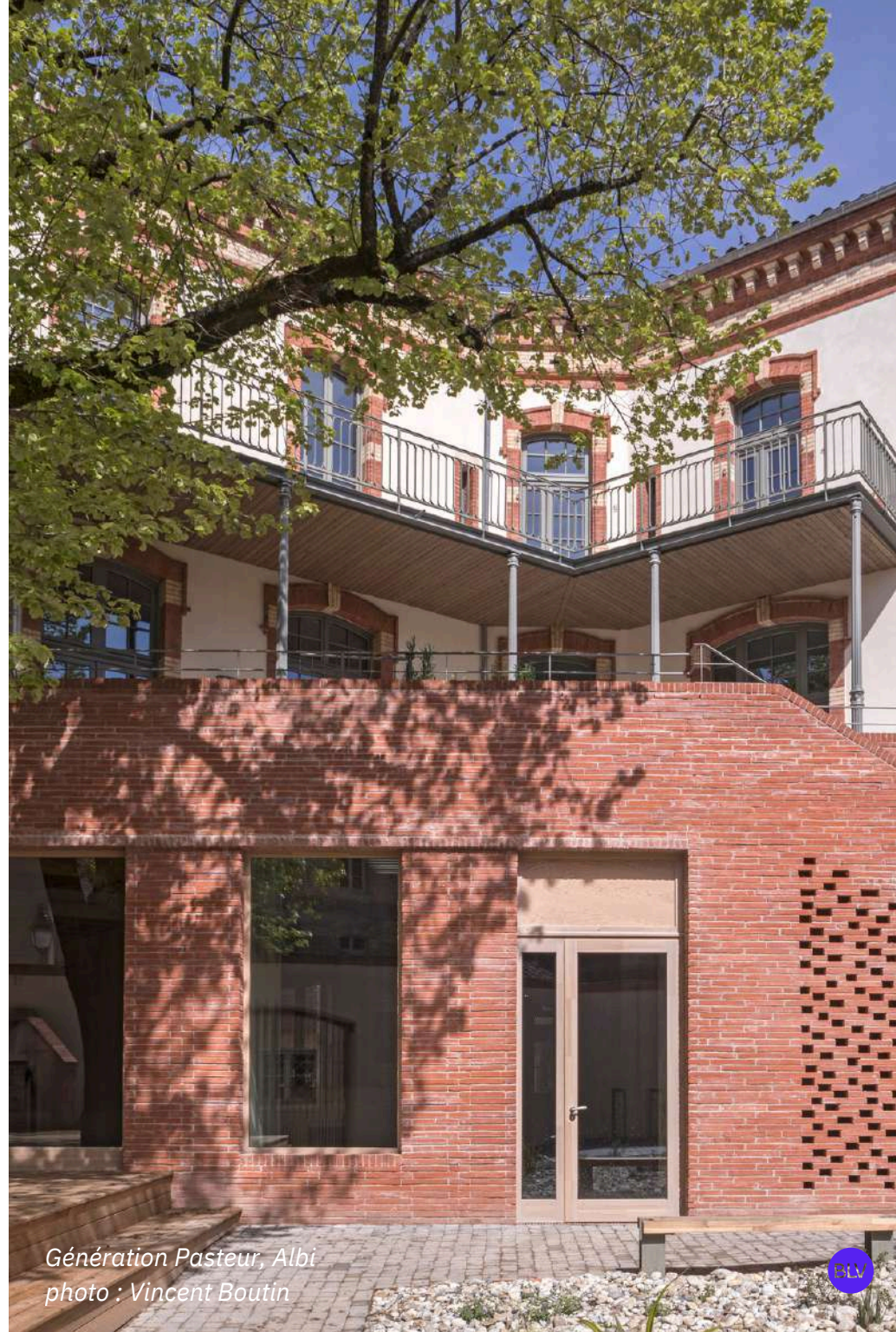
Génération Pasteur, Albi

En 2022, Bellevilles est sur le podium du Top 50 de l'entrepreneuriat à Impact . En 2023, Bellevilles est lauréat des Trophées de l'Économie Sociale et Solidaire de la Ville de Paris. En 2024, Bellevilles est lauréat du Palmarès des Jeunes Urbanistes .