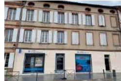
ALBI LAPEROUSE Logement