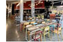
TOULOUSE LES 500 Tiers-lieux