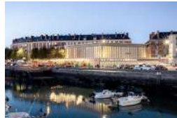
LE HAVRE LA HALLE AUX POISSONS Activités ESS Tiers-lieux